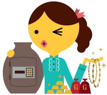
ผู้ลงทุน