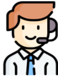
ผู้แนะนำ