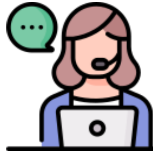
โต๊ะ Block Trade